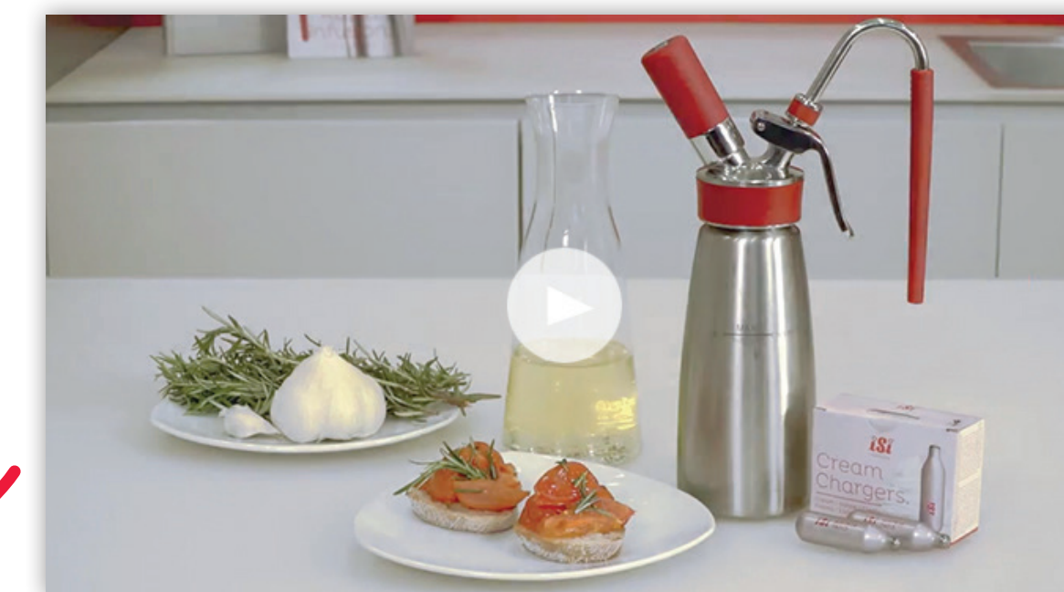
Video 2: Rosmarin Öl selbst gemacht.