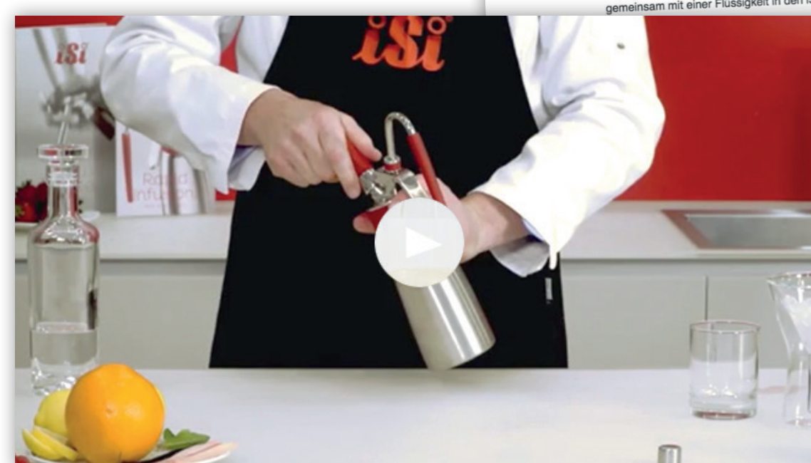
Video 1: Was ist Rapid Infusion?